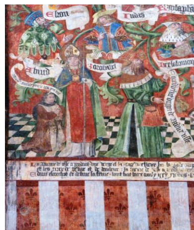
L'arbre de Jessé de l'église Saint Prix et Saint Cot de Saint-Bris-le-Vineux

Cette peinture murale, qui orne le chœur de l'église est exceptionnelle par sa taille (7,5 x 5 m), par le nombre des personnages peints (52) ; de plus, elle est accompagnée d'un texte qui en précise la date (1500), le sujet et le nom des donateurs. À l'inverse du modèle de Semur-en-Auxois, c'est ici la parenté charnelle