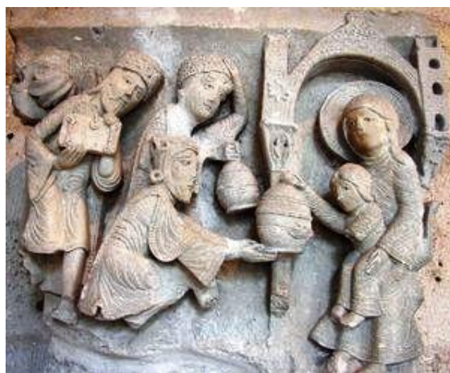
Cathédrale d'Autun – Chapiteau représentant les mages se rapprochant de l'enfant, assis sur les genoux de la Vierge. Chacun tient un vase contenant de l'encens ou de la myrrhe. Le troisième, en retrait, porte une cassette, remplie d'or.