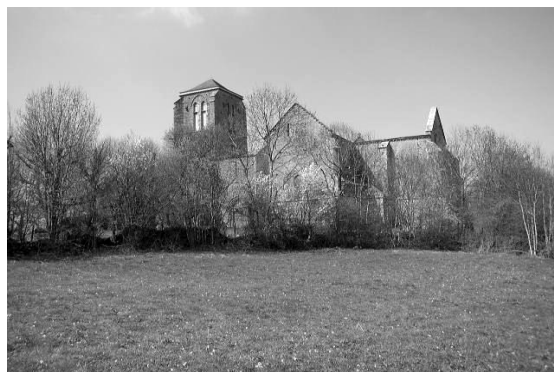
La collégiale de Thil