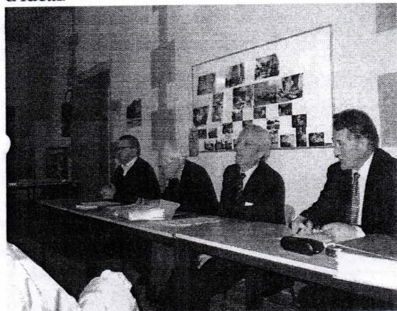
Allocution du Président

Heureusement, l'Art ne peut être banalisé, ni délocalisé par intérêt. Il attire ! Comme les services de proximité, les métiers d'Art et les produits manufacturés garderont leur place devant les productions mécanisées. Pour s'épanouir l'homme de toutes les cultures aura toujours besoin de poésie, et la jeunesse d'idéal.