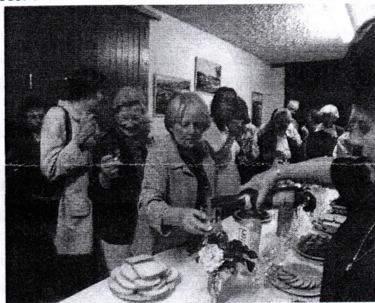
Le groupe fait une petite pose pour déguster différents crus de chablis à Beine (Yonne)

retardataires. Ceci m'amène à vous redire que dès l'instant où vous recevez l'invitation, ne tardez pas à vous inscrire adhérents ou non adhérents. En effet, les restaurateurs aiment savoir, au minimum 8 jours avant la date retenue, le nombre de convives. A titre d'exemple, pour ce 12 juin, nous avons fait modifier 3 fois le nombre de personnes dans les 5 derniers jours. Pensez au travail que cela occasionne, appels téléphoniques, courriers, etc. !