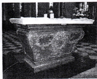
L'autel principal à restaurer

Pour commencer, nous pouvons déjà, à une heure de Paris, créer des expositions d'objets d'Art sacré, dans le petit cloître, puis, faire connaître cette aspiration vers les métiers d'Art, susciter