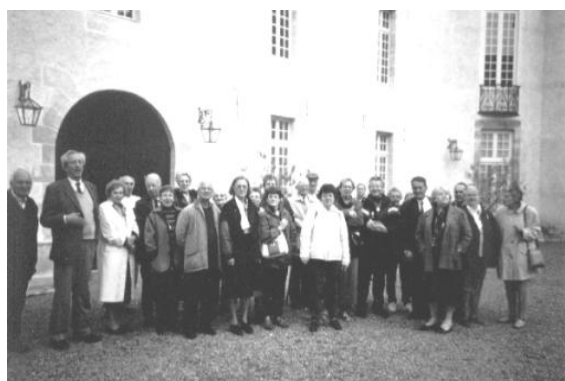
Dans la cour du château de Basoches

La sortie du 23 juin a réuni 25 personnes, très satisfaites de la journée passée à Tournus, Chapaize et Brancion.