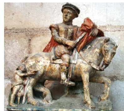
Eglise Saint Germain à Auxerre Saint Martin