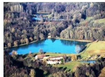
Le moulin du Vanneau

Nous vous proposons une visite en Puisaye-Forterre, le samedi 2 juin, (la température est plus clémente et les jours plus longs) terres de potiers et église à fresques, ferme du Moulin de Vanneau et son restaurant de terroir.