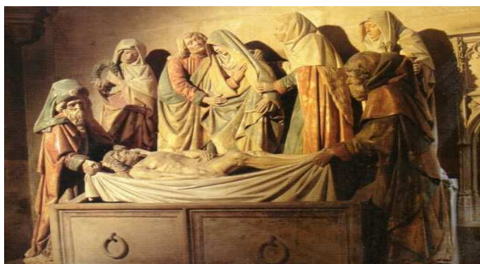
« La mise au tombeau » 1495 chef d'œuvre de l'école bourguignonne dans la suite de Claus Sluter.

Une ou deux œuvres décrites et expliquées par Céline Duchesne, description et explication accompagnées musicalement par Étienne Jacquot : « La mise au tombeau » et le « Christ assis » avec deux chorals de Johann Sébastien Bach, l'« Agnus Dei » BWV 656 et le choral de communion « Jésus Christ, notre Sauveur » BWV 688.