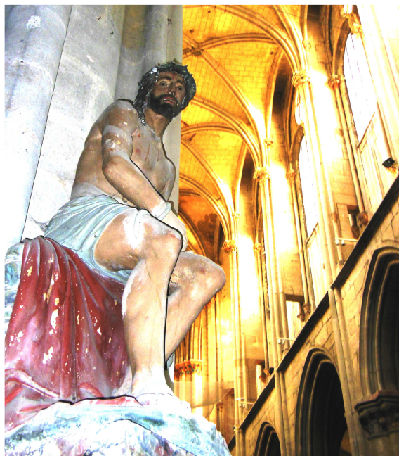
Le Christ aux Liens - Collégiale Notre-Dame

Tout ceci participe de notre inscription dans la vie de la cité. Nous avons notre identité que nous mettons au service de tous car le patrimoine doit être une valeur pour tous, c'est notre conviction !