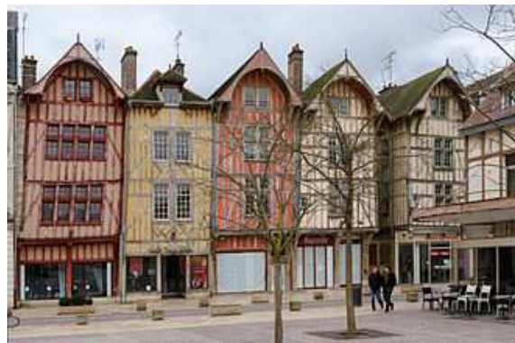
Maisons de la vieille ville

Troyes est la ville aux dix églises, d'une