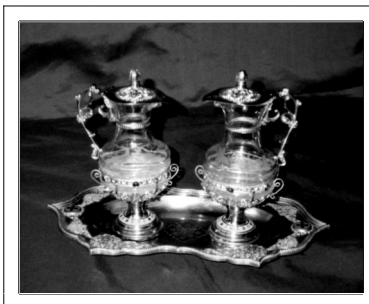
Les burettes restaurées

En 2001, nous avons fait réparer et redorer une magnifique paire de burettes du XIX ème qui a t été réutilisée pour la 1 ère fois, lors des fêtes de Pâques 2002.