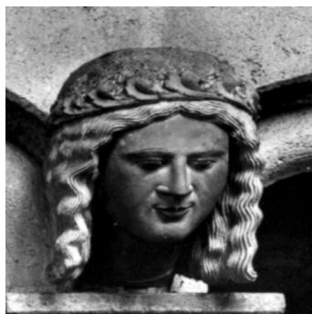
Tête du Triforium