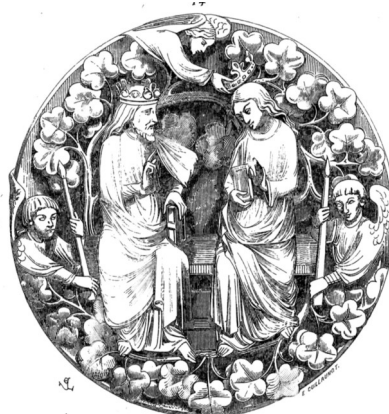
Le logo de l'Association Le couronnement de la Vierge. Clé de voûte de la Collégiale