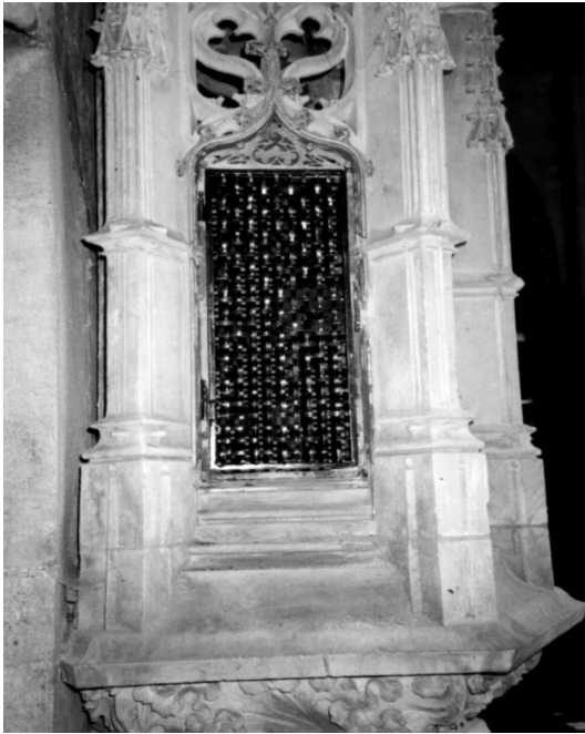
La petite porte du ciborium après restauration. Obélisque datant du XVème siècle. Colonne de 7m. de hauteur qui servait jadis à conserver l'Eucharistie

Nos concerts : Jean-Claude Duperron fait vibrer les profondes sonorités de l'orgue de Notre-Dame.